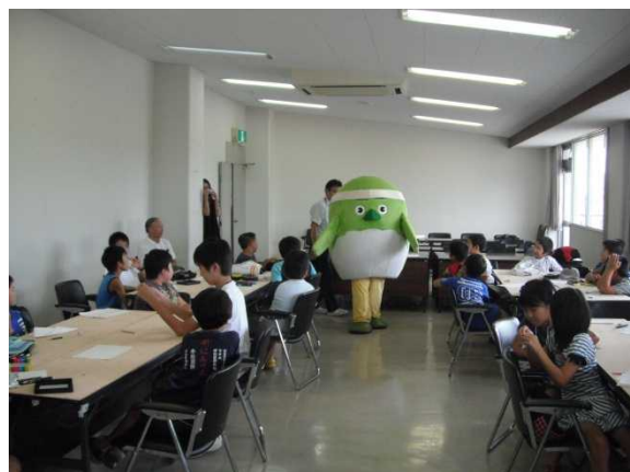
県のゆるキャラ「めじろん」も応援に来場