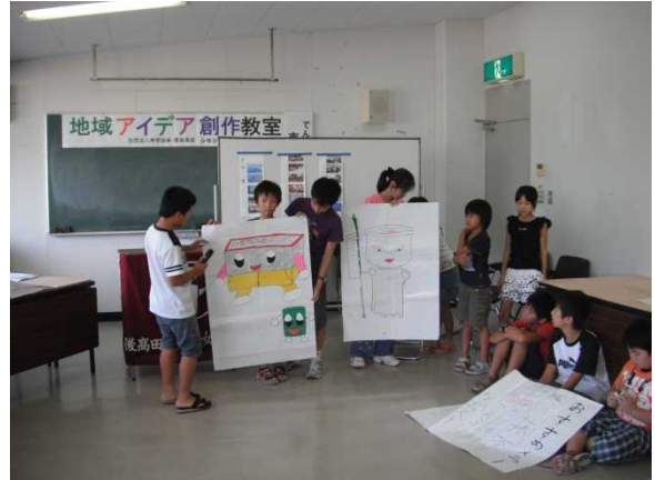
ゆるキャラ(案)の発表