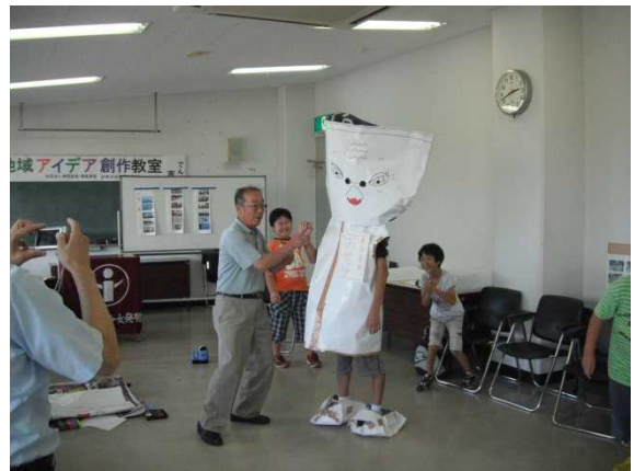
模造紙で作ったゆるキャラのサンプル