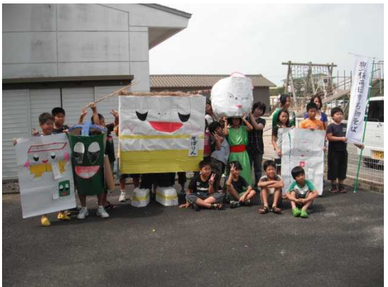
作品完成時の記念撮影