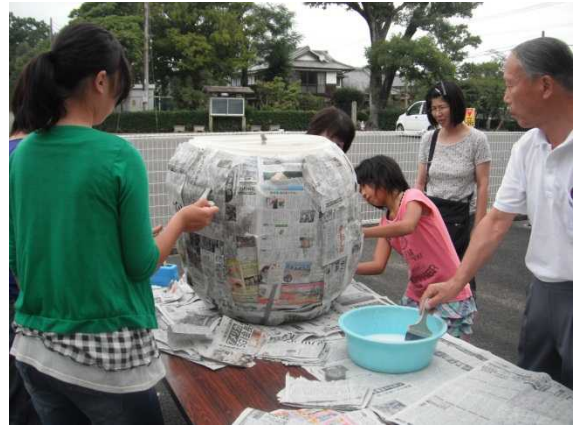
ゆるキャラの製作(どんぶりそば)