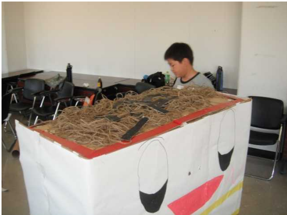
ゆるキャラの製作(ざるそば)