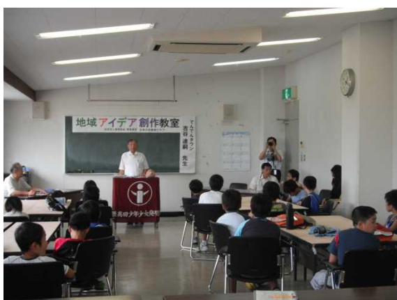
そば組合の方から「名物のそば」の説明