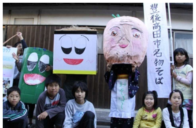
そば祭りでの発表