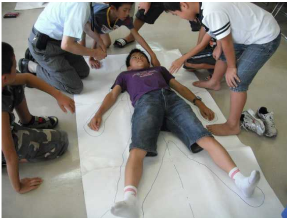
実物大(子ども用)の型紙作成