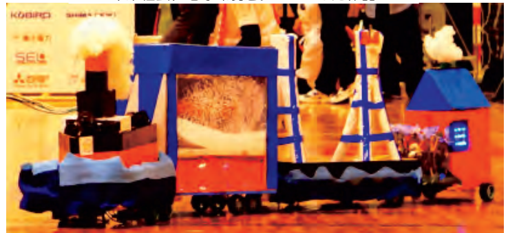
産業、技術をテーマにした作品