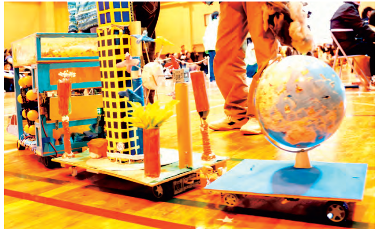
未来社会、地球環境をテーマにした作品