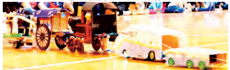
歴史、乗り物をテーマにした作品