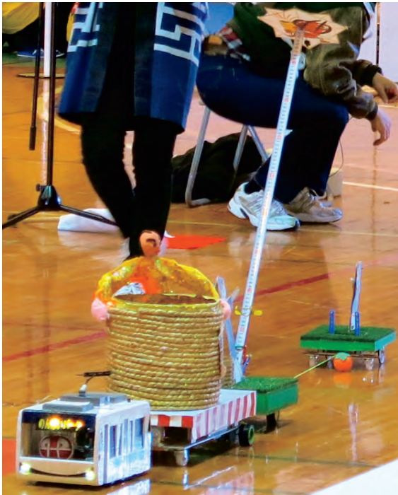
第6回大会 文部科学大臣賞 愛知県代表「コットンキャンディー」(作品：凧あげ)

テーマ からくりパフォーマンスカー ～ 未来・環境・宇宙・スポーツ・地元 e.t.c ～