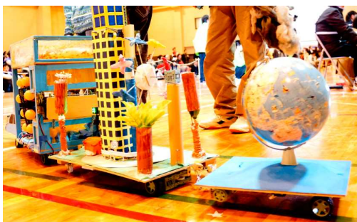
未来社会や地球環境をテーマにした作品（第6回大会）