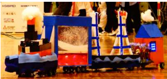
最新技術、地球環境をテーマにした作品（第5回大会）