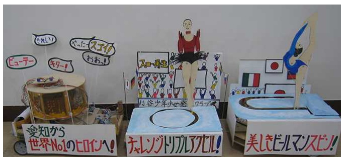
スポーツ、地元をテーマにした作品（第5回大会）